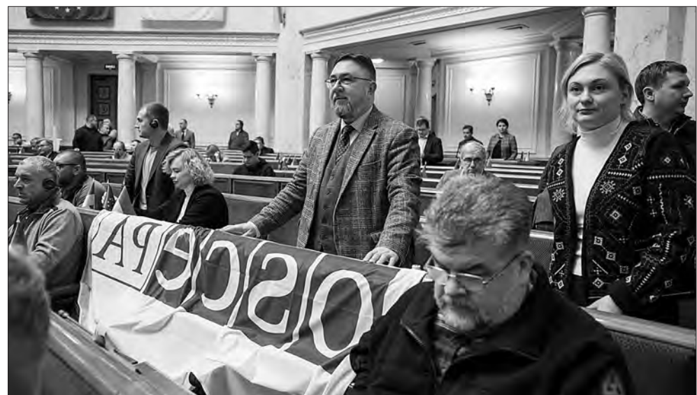
Під час засідання.

Слава Україні! Прес-служба Апарату Верховної Ради України. Фото Андрія НЕСТЕРЕНКА. Більше фото тут — www.golos.com.ua